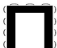
salle en «U»