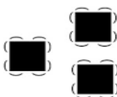
salle en îlots