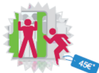
Obstacle à la fermeture des portes