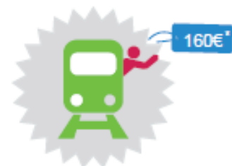
Se pencher en dehors des portières