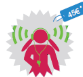
Utilisation d'un appareil sonore