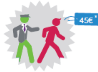
Refus d'obtempérer à l'injonction d'un agent SNCF