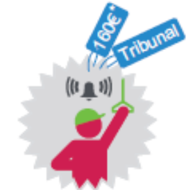
Usage injustifié du signal d'alarme 160€ ou 6 mois d'emprisonnement et 3 750 € d'amende si usage avec intention de troubler

*Tarifs en vigueur au 1 er juillet 2011, n'incluant pas les frais de dossier.