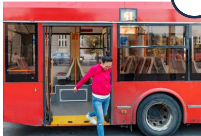
Prendre le bus