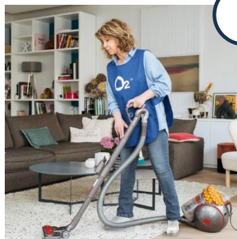
Prestation de l'après-midi