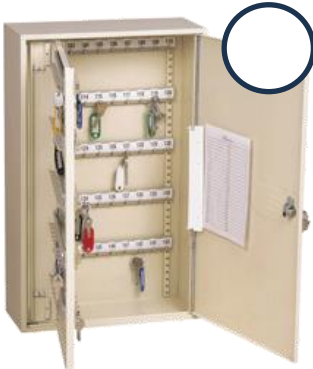
Récupération des clés

Exercice 2 : Écoutez à nouveau la description de la journée type présentée par l'employeur. Numérotez les images ci-dessous pour remettre les informations dans l'ordre dans lequel elles sont données.