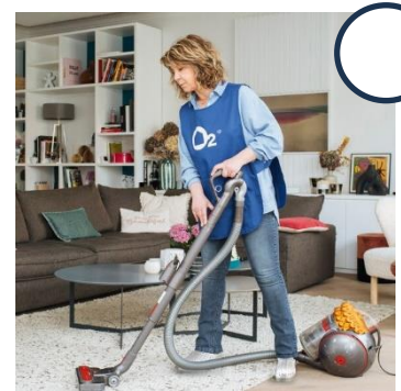
Prestation chez un premier client